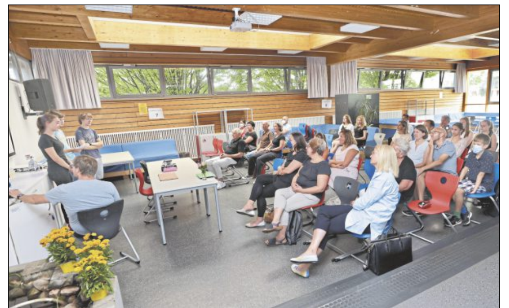
In Kleingruppen entwickelten Schüler der Jahrgangsstufe neun technische Projekte.